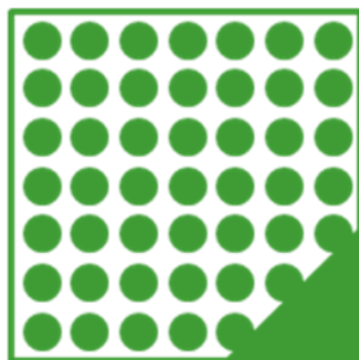
ORAFLEX® 11525 мягкая