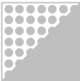
ORAFLEX® 11555 средняя